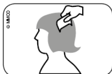
Fig. Pasar la lendrerita por el cabello mojado, desde el cuero cabelludo hasta las puntas.